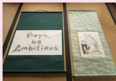
② どの掛軸を飾ろうかな？