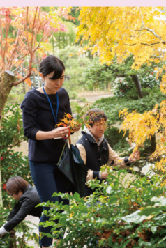
③ どんなお花が合うかな？