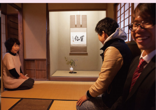
⑤ 素敵な空間ができました！