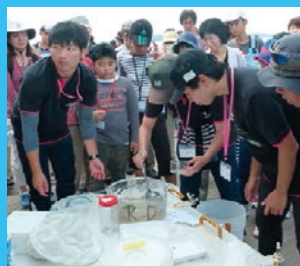
昨年度の洋上セミナーの様子