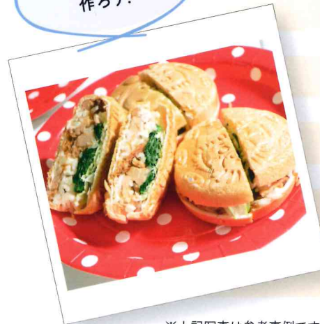
※上記写真は参考事例です